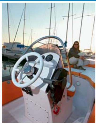
Konzola je dobro popunjena