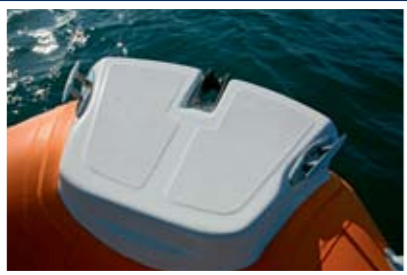
Kaštanjole su postavljene previše bočno