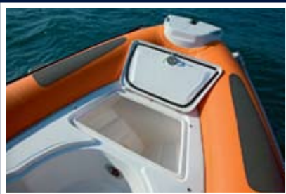
Veliki pramčani škaflako je dostupan

Kontinuirana proizvodnja gumenjaka Maestral traje već preko trideset pet godina, a među popularnijim modelima ovog proizvođača bio je četrina metra i osamdeset centimetara dug H80 . Jedna od zamjerki ovom modelu odnosila se na relativno nisko postavljen tubus na pramcu, preko kojeg su u plovidbi po valovitom moru kapljice mora močile kokpit. AD brodovi su prije desetak godina predstavili nasljednika Maestral 490 , a sada i njegovu novu redizajniranu verziju koja nam je ponuđena za test.