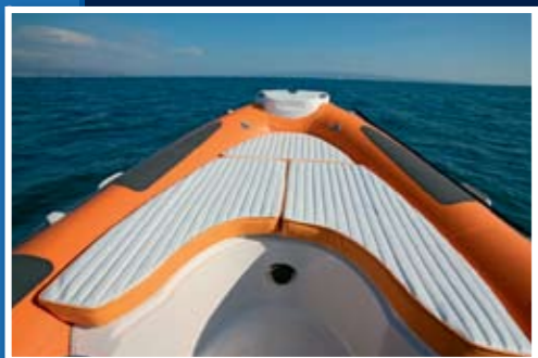
... i još troje ostalih