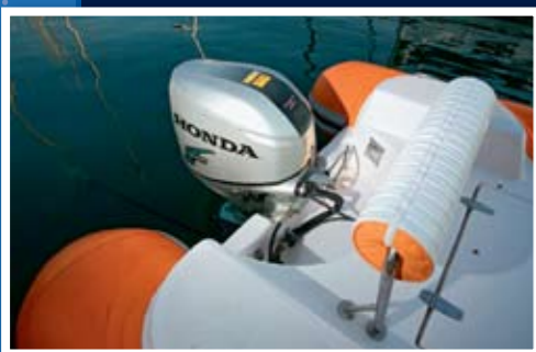
Nova krma štiti kokpit od prskanja valova