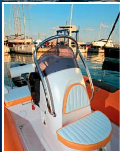
Mjesto za jednog VIP putnika..