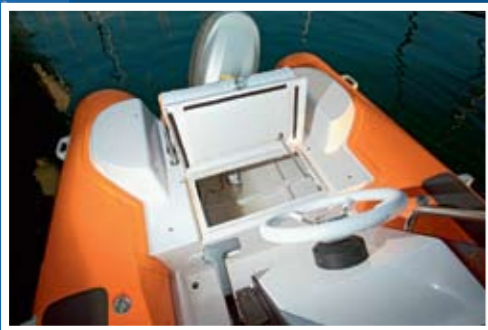
Ispod sjedala je veliki gavun