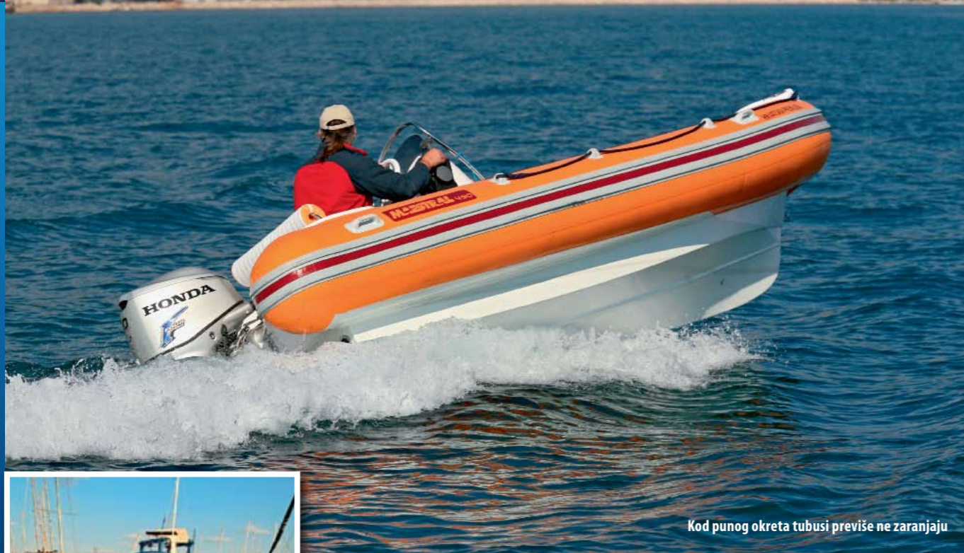
Kod punog okreta tubusi previše ne zaranjaju